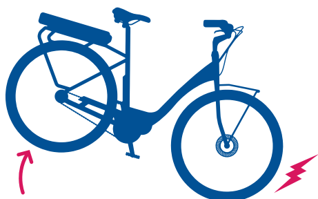
Cykel uden ABS

Blokering af forhjulet, øger risikoen for, at baghjul løfter sig, og cyklisten falder over styret.